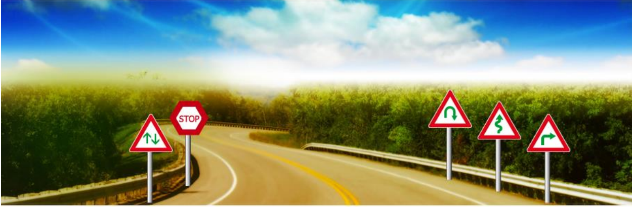
Constructions Road Signs in Pakistan

These sign normally in yellow colors, for example work in progress. purpose you reduce the speed and be careful.